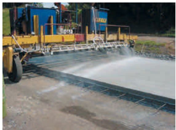
Figura 11 – Máquina aplicadora de cura química, sem aba de proteção, notando-se perda de produto pela ação do vento