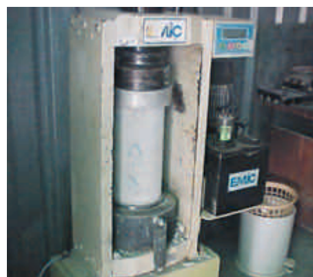
Figura 3 – Verificação da resistência mecânica do concreto