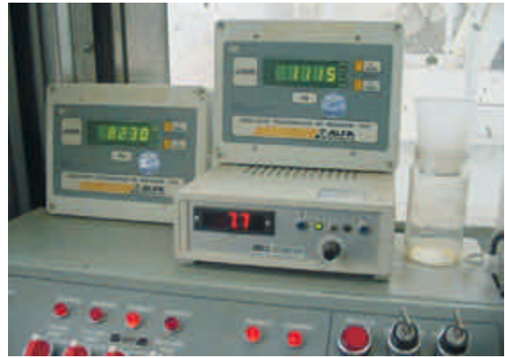
Figura 6 – Comando computadorizado de central gravimétrica