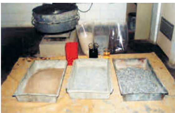
Figura 1 – Verificação do concreto como material

Existe uma relação de interdependência entre as duas etapas, ou seja, o sucesso ou insucesso de uma delas implicará o sucesso ou insucesso da outra. Daí a importância de ambas serem bem cumpridas para garantir a qualidade da obra.