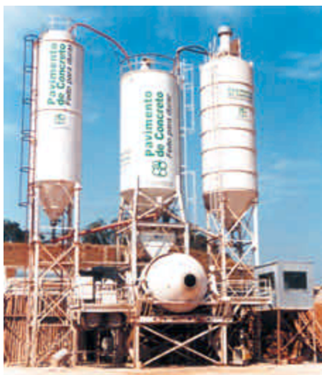
Figura 5 – Central gravimétrica misturadora, para transporte do concreto por caminhão-basculante

Observar se o laboratório de campo tem de igual modo equipamentos em boas condições, com os de medição também devidamente aferidos como os do laboratório central responsável pela análise dos materiais e pela dosagem original.