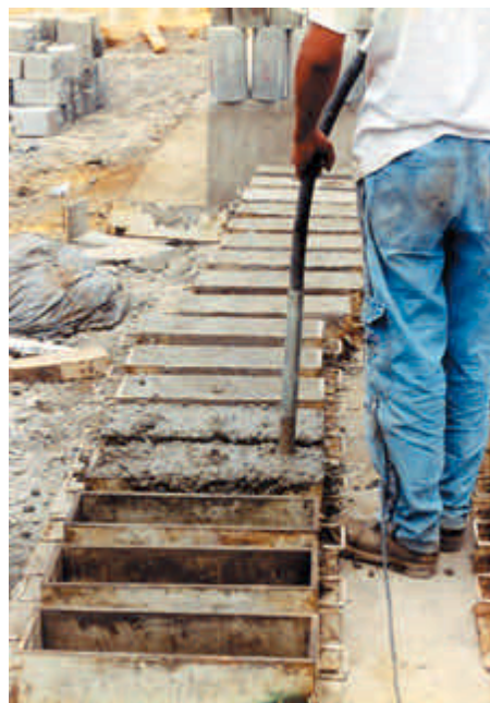
Figura 15 – Moldagem de corpos-de-prova prismáticos e cilíndricos de uma mesma amassada que, após curados, serão destinados aos ensaios de resistência mecânica

Para controle da resistência à tração na flexão , retirar uma amostra representativa de cada lote inspecionado e de um número inteiro de placas do pavimento, constando de 32 exemplares de 2 corpos-de-prova prismáticos cada, com dimensões de 15 cm x 15 cm x 50 cm, moldados de uma mesma amassada e no mesmo ato (adensados preferencialmente com vibrador de imersão), conforme a NBR 5738, curados sob os ditames dessa mesma norma, e ensaiados em concordância com a NBR 12142 (ensaio dos 2 cutelos). Amostrar todo caminhão para a moldagem dos corpos-de-prova.