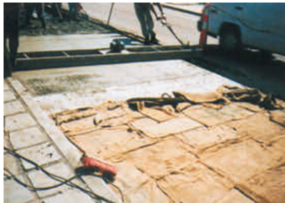
Figura 14 – Cura úmida com mantas constantemente umedecidas

No caso de taxa de evaporação muito elevada, pode-se exigir a cura úmida final, 24 horas a 72 horas após a aspersão do produto químico, tempo suficiente para que a superfície do concreto não seja marcada pela manta de cura, lençol plástico, ou qualquer outro material que deverá ser mantido constantemente umedecido durante, no mínimo, 7 dias.