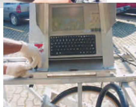
Figura 20 – Computador que grava os desvios verticais, traçando o perfil do pavimento