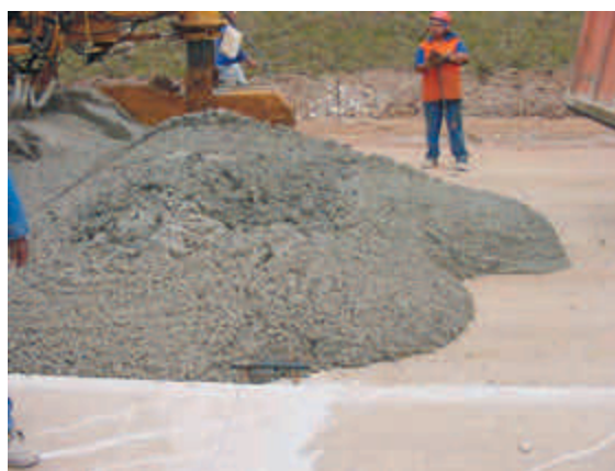
Figura 7 – Análise visual do concreto recém-chegado na pista

Com a mesma freqüência adotada para o controle na usina, e utilizando as mesmas metodologias de ensaio prescritas, verificar a consistência e o teor de ar incorporado do concreto recém-chegado na pista, que deverão estar dentro da faixa especificada. Inspeccionar visualmente todo caminhão, antes de sua liberação para descarga.