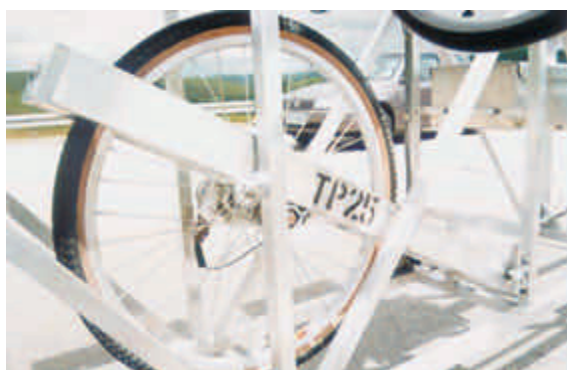
Figura 19 – Roda sensora livre do perfilógrafo para captar movimentos verticais, os quais são enviados para um computador