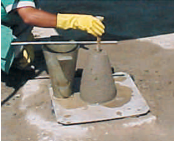
Figura 4 – Análise da dosagem e materiais

Constatar também se o fornecedor é o mesmo e se a graduação dos agregados e a procedência dos materiais são as mesmas daqueles levados ao laboratório central e de campo para ensaios e dosagem. Somente depois dessas verificações a produção poderá ser liberada para a execução da camada.