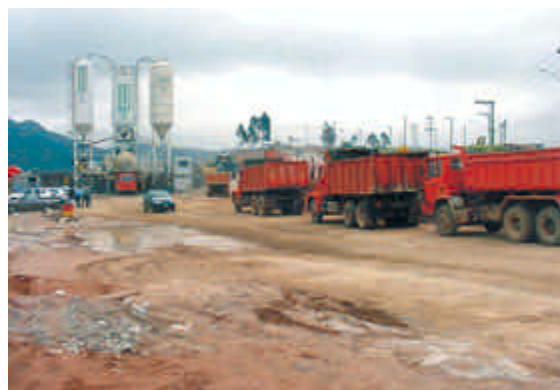
Figura 2 – Verificação da compatibilidade do transporte com as características do concreto