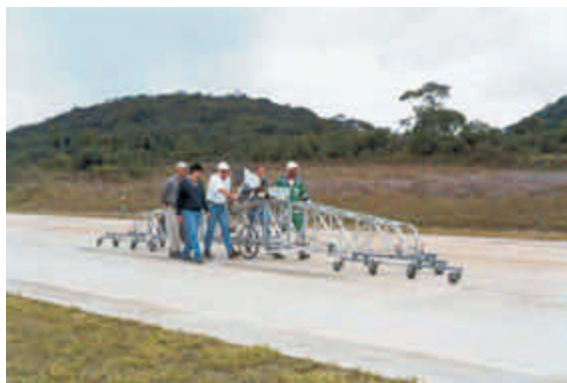
Figura 18 – Perfilógrafo Califórnia para verificação do conforto de rolamento

Quanto ao conforto de rolamento , verificar a irregularidade superficial pela passagem diária de um perfilógrafo, cujo índice não deverá ultrapassar 240 mm/km.