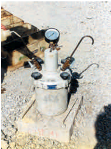
Figura 9 Colocação de água para retirada de ar, antes da leitura do teor de ar incorporado (método pressiométrico)

Interromper a concretagem sempre que houver dificuldade de manutenção da consistência e do teor de ar incorporado dentro da faixa especificada, até a resolução do problema.