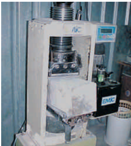
Figura 20 – Ensaio de resistência mecânica em prensa computadorizada

Toma-se como valor da resistência do exemplar o maior dos valores de resistência dos 2 corpos-de-prova que o compõem.