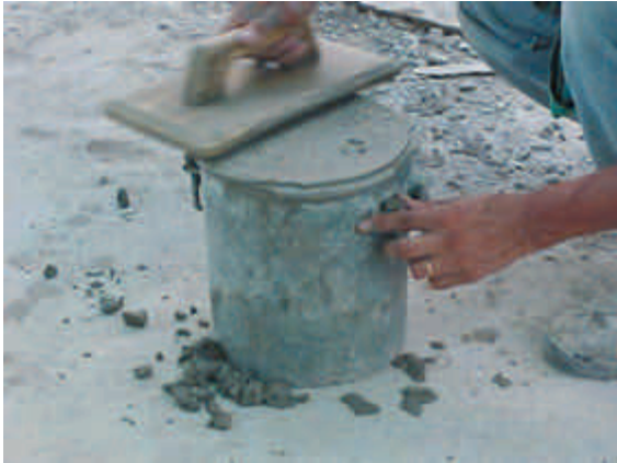
Figura 8 – Preenchimento e acabamento do recipiente para verificação do teor de ar incorporado pelo método pressiométrico