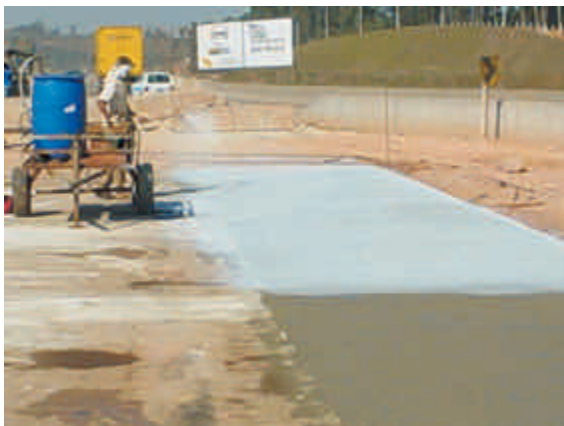
Figura 13 – Aplicação manual de cura química, aspersor costal. Notar que o bico deveria estar mais próximo da superfície, para não ocorrer perda de produto

Na inspeção da homogeneidade e taxa de aplicação, fazer no mínimo duas verificações diárias, sendo que a homogeneidade é observada visualmente. Dependendo das condições climáticas (calor, baixa umidade relativa do ar e vento constante), providenciar o aumento da taxa de aplicação devido ao aumento da taxa de evaporação.