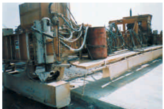
Figura 12 – Máquina aplicadora de cura química, com aba de proteção