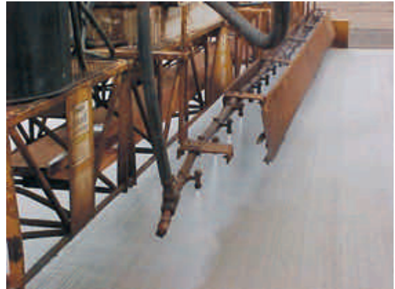
Figura 10 – Cura química por meio de máquina aplicadora

É importante verificar se o produto está sendo aplicado também nas laterais da pista.