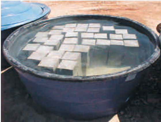
Figura 19 – Corpos-de-prova prismáticos, devidamente adensados e curados